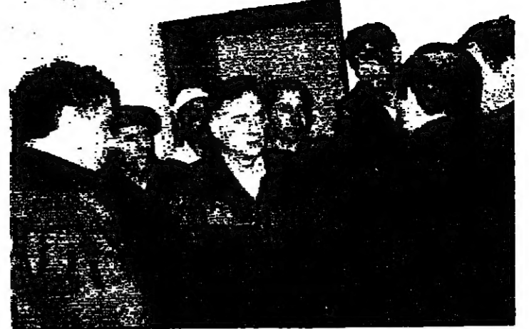
لويراني وحده في حاصبيا

الحزام الامني - الأتوار: نفذت القوات الاسرائيلية مناورة عسكرية في الحزام الامني هي الأضخم منذ انشاء الحزام في العام ١٩٨٥. واغلقت القوات الاسرائيلية جميع الطرق في القطاع الشمالي وكذلك بوابات العبور. وشركت المروحيات الاسرائيلية في المناورات. وكذلك جيش لبنان الجنوبي.